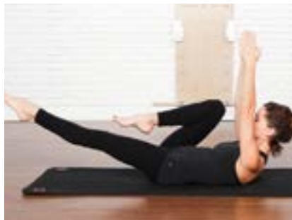
Brazos extendidos hacia el techo