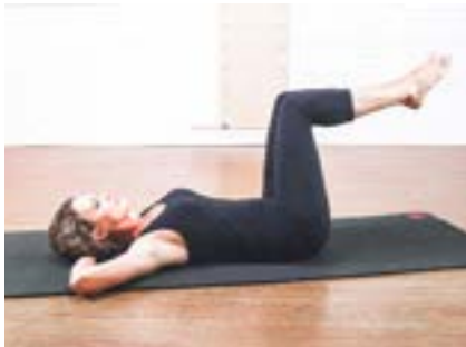
Tabletop | 1