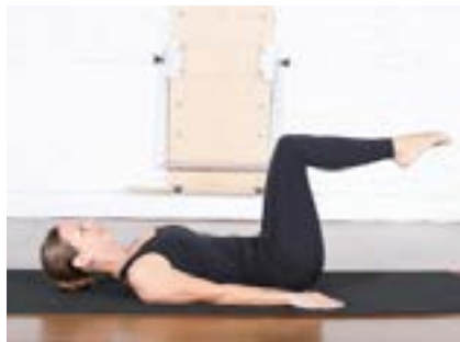
Double Legs | 1