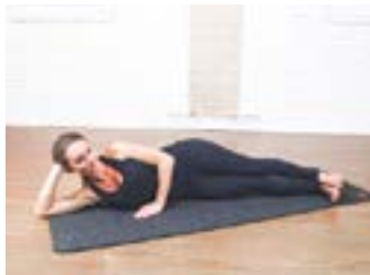
External Rotation | 1