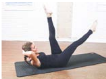
Manos detrás de la cabeza