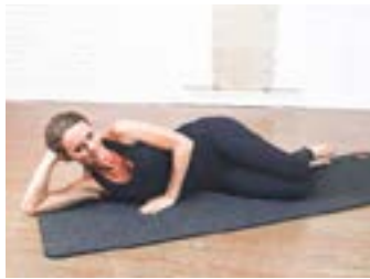
Clam | 1