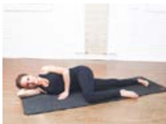
Inner Thigh Lifts | 1