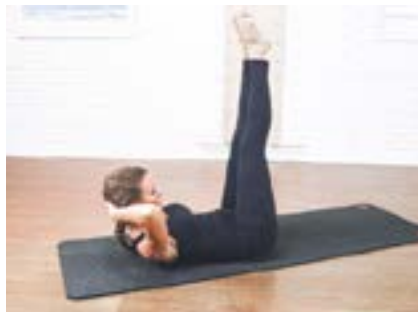
Flexión torácica | 1