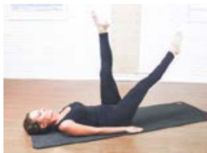
Omita la flexión