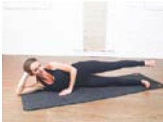
Leg Raises | 1