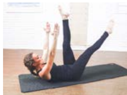
Brazos alargados hacia el techo